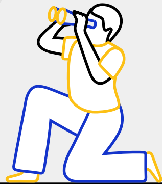
ملاحظة الإشارات الدالة

54% أبلغوا أنهم وقعوا ضحية لعملية احتيال، و 17% عدة مرات.